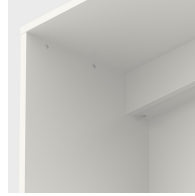
Mit integriertem Kabelkanal, hinten