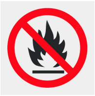
Trägerplattenmaterial schwer entflammbar nach DIN 4102 B1