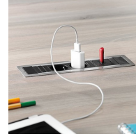
Optional je zwei Stockdosen mit USB Port oder Netzwerkanschluss: 1x mittig, 1x links, 1x rechts oder beidseitig