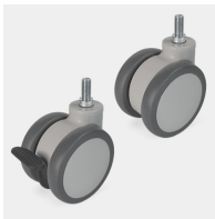
Fahrbar auf 4 Rollen davon 2 feststellbar