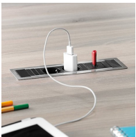
Optional je zwei Steckdosen mit USB Port oder Netzwerkanschluss: links und rechts