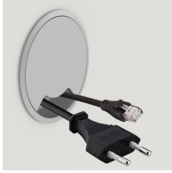
Optional mit seitlichem Kabeldurchlass