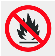
Trägerplattenmaterial schwer entflammbar nach DIN 4102 B1