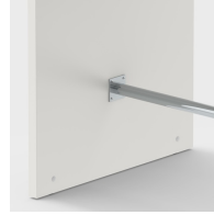
Inklusive Fußstütze zum bequemem ablegen der FüÙe