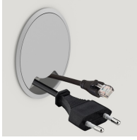
Optional mit seitlichem Kabeldurchlass