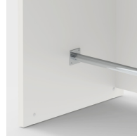
Inklusive Fußstütze zum bequemem ablegen der FüÙe