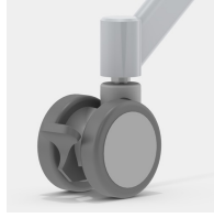
Inklusive 4 robusten Doppellenkrollen mit Totalfeststellung