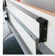
Auslösen der Klappfunktion mittels 2-Hand- Sicherheitsbedienung