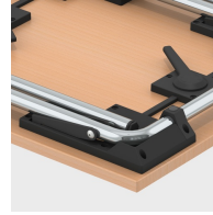
Stapelschoner schützen die Tischplatte vor Kratzspuren