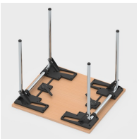
Einfaches Einklappen der Tischbeine