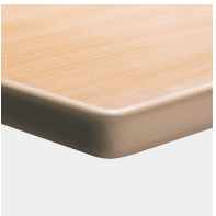
Optional Tischplatte melaminharzbeschichtet mit ASSODUR®-Kante