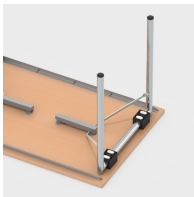
Einfaches Einklappen der Tischbeine