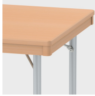
Optional mit zurückgesetzter Massivholzzarge