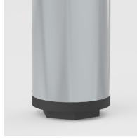
Bodenschoner mit Niveauegleich: gleicht Bodenebenheiten aus