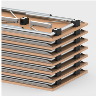
Bis zu 16 Tische stapelbar