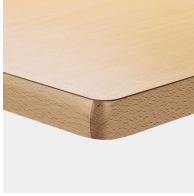
Optional Tischplatte melaminharzbeschichtet mit Massivholzkante