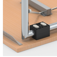
Stapelschoner schützen die Tischplatte vor Kratzspuren