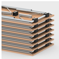
Bis zu 16 Tische stapelbar