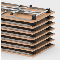
Bis zu 16 Tische stapelbar