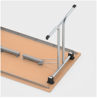
Einfaches Einklappen der Tischbeine