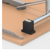
Stapelschoner schützen die Tischplatte vor Kratzspuren