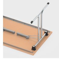
Einfaches Einklappen der Tischbeine