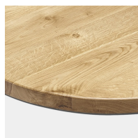
Optional mit Eiche-Massivholz Tischplatte