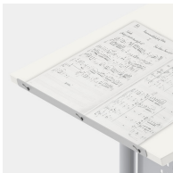
Inklusive Buch-Anschlagleiste vorne