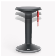
Stufenlose Gaslifthöhenverstellung, Auslöser per Textil-Handschlaufe