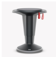
Aktives und gesundes Sitzen durch konvexe Standfläche