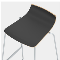
Unsichtbare Befestigung der Sitzschale