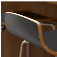
Robuste Buche-Multiplexschale mit kratzfester CPL-Beschichtung