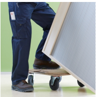
Korpus ab Werk fest verdübelt und verleimt für schnellen Aufbau vor Ort