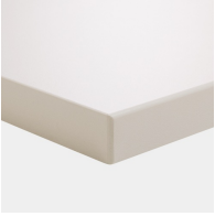
Plattenmaterial melaminharzbeschichtet mit robuster Kunststoffkante