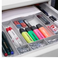
Utensilienauszug für Büromaterialien