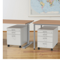
Passend zu unseren OFFICE Tischen und 1000er, 2000er Tischserien