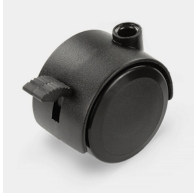
Fahrbar auf 4 feststellbaren Doppelrollen