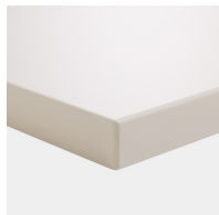
Plattenmaterial melaminharzbeschichtet mit robuster Kunststoffkante