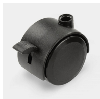
Fahrbar auf 4 feststellbaren Doppelrollen