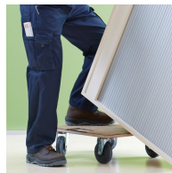
Korpus ab Werk fest verdübelt und verleimt für schnellen Aufbau vor Ort