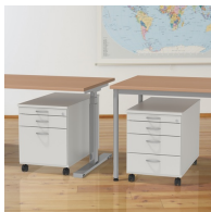
Passend zu unseren OFFICE Tischen und 1000er, 2000er Tischserien