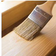
Umweltfreundlich mit Lack auf Wasserbasis lackiert.