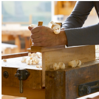
Massives Buchenholz aus nachhaltiger Forstwirtschaft