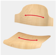
Körpergerecht geformter Sitz und Rücken