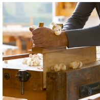
Massives Buchenholz aus nachhaltiger Forstwirtschaft