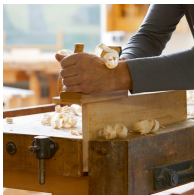
Massives Buchenholz aus nachhaltiger Forstwirtschaft