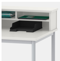
Ablagefach schafft Ordnung und bewahrt Übersicht