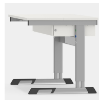
Hohe Beinfreiheit im geschlossenen Zustand