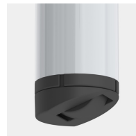
Optional Gestell fahrbar mittels 2 Rollen