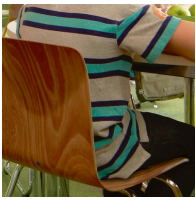
Ergonomisch geformte und flexible Schalenform