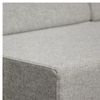
Langlebige Qualität durch hochwertige Verarbeitung