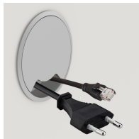
Optional mit seitlichem Kabeldurchlass