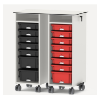
Zusätzliche Arbeitsfläche durch Aufsatzplatte