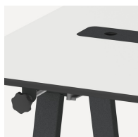
Multifunktional durch verschiedene Ausstattungsmöglichkeiten