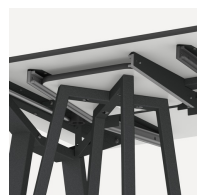
Halterung für FLEXLAB Hocker und Tidy Boxen