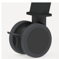
Vier große Doppelaufrollen jeweils mit Feststellbremse