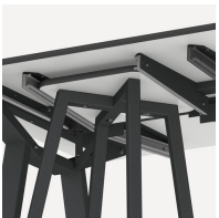
Halterung für FLEXLAB Hocker und Tidy Boxen