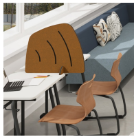
Als Sichtschutz auf Schultischen